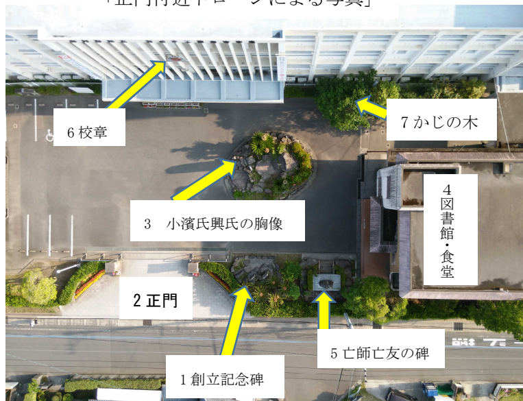
「正門付近ドローンによる写真」