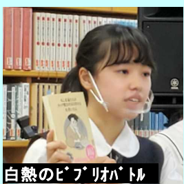
白熱のビブリアバトル

10月17日(土)の午後、加治木高校図書館にて、J・O・B (joy of books) が開催されました。今回は、新型コロナウイルス感染症対策のため、生徒・職員のための観覧となりました。恒例のビブリアバトルの他、朗読、ブックトーク、英語キットが披露されました。さらに、コーラスや独唱の歌声に加え、ヴァイオリンやピアノ、ギターなど、さまざまな楽器の音色が室内に響き、午後の心地よいひとときを過ごすことができました。