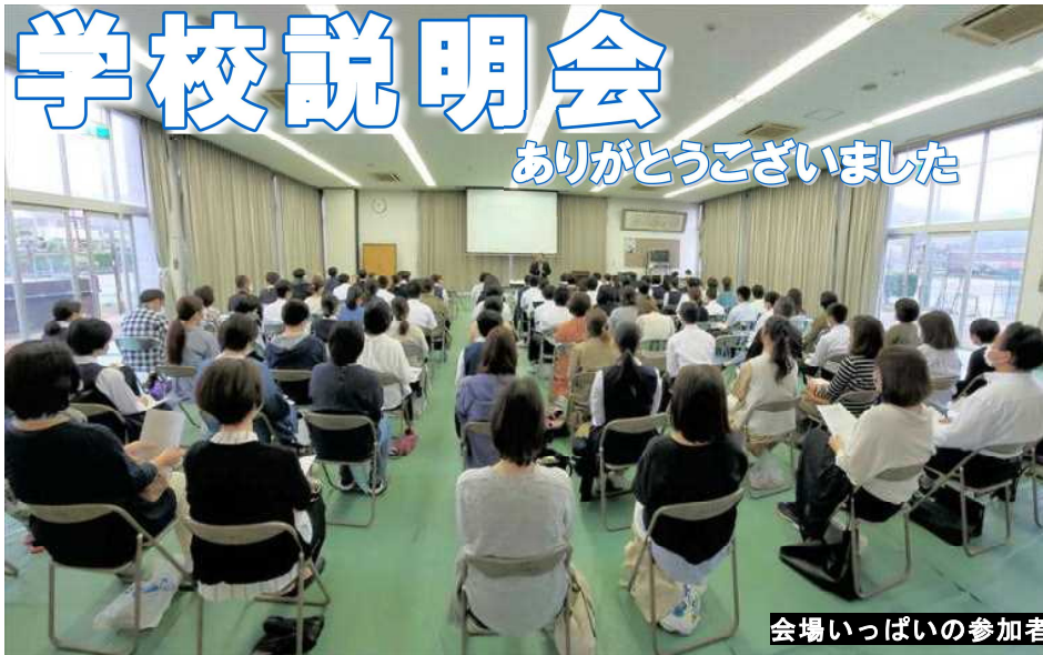
会場いっぱいの参加者

10月17日(土)に実施した学校説明会には、100人を超える中学生や保護者の皆さんに参加していただきました。