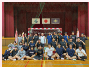
ハンドボール部 南九州大会県予選