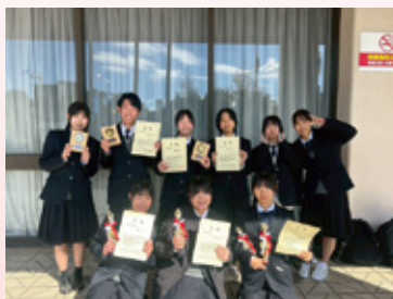
書道部 第36回県揮毫大会

ハンドボール部の男女が南九州大会県予選で共に優勝しました。また、卓球部男子団体が県新人戦で4位、ラグビー部が県1・2年生大会(10人制)で3位になり、それぞれ九州大会に出場します。