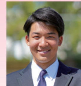
3年小牧來竜 (帖佐中出身)

進学校の行事と聞いて皆さんはどのような印象を持ちますか? 学校の規則に縛られて楽しめなさそう! そう考える人が多いはずですが、しかしそれは大きな間違いです。毎日の勉強や部活動に明け暮れた加治木高校生にとって、行事はかけがえのない青き青春の1ページなのです。特に「龍門祭」。私も二年では応援団長を務め夏休みから仲間と汗と涙を流しました。加治木高校生は行事への熱が強く、光輝く目で「アオハル」をつくっていますよ!