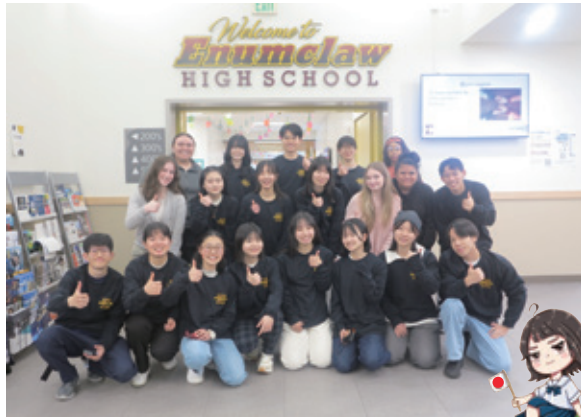
令和5年度海外短期研修 Enumclaw高校にて

環境・エネルギー・人権といった現代のあらゆる問題を克服するには、人類が一個の惑星を共有する地球人としての視座を獲得することが必要です。その素地を育むための事業です。