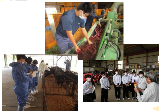
各学科の視察・体験実習の様子

10月下旬に農業科・生物工学科・畜産科の各学科2年生が地元農家や企業の方々にご協力を頂き視察研修を行いました。例年は農家委託実習という形で、受入農家で1週間の実習を行っていますが、今年度はコロナ禍もあり視察研修という形で1日限りの実施でした。実際に農家さんとふれ合いお話を聞く機会が少なくなりましたが、今回の視察研修や体験実習を通して、生徒が農業に関する興味や理解を深め、これからの学校生活や進路実現に役立つ良い体験になりました。