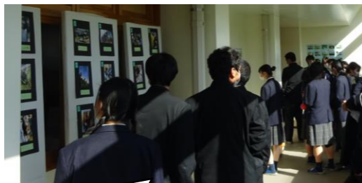
展示部門グランプリ 畜産科実習風景の写真展