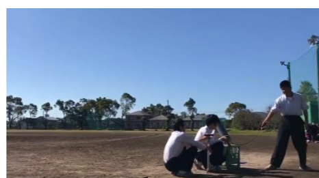
農業機械科による ペットボトルロケット打ち上げ

コロナ渦で、開催自体が危ぶまれた学校祭でしたが、感染症対策を十分に行い、規模を縮小して11月13日(金)に行いました。例年あった保護者や近隣の方々が楽しめるイベントを今年には行わず、生徒のみ参加で、ステージの部も2部構成で、密を避けて学年入れ替わりで行われました。