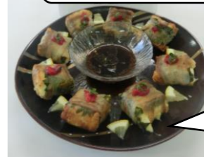
グランプリ受賞作 黒豚の揚げ巻き