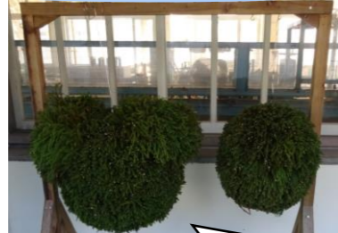
「杉玉」 緑地工学・農林環境科