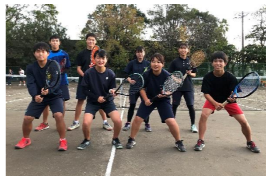
硬式テニス部 「大会で全員一勝！」が目標

私たち硬式テニス部は男子4名、女子4名で活動しています。地区大会団体優勝を目標として、日々の練習に一致団結して励んでいます。