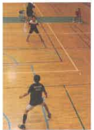
男子バドミントン部