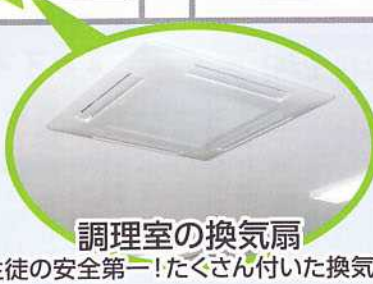
調理室の換気扇(生徒の安全第一!たくさん付いた換気扇)