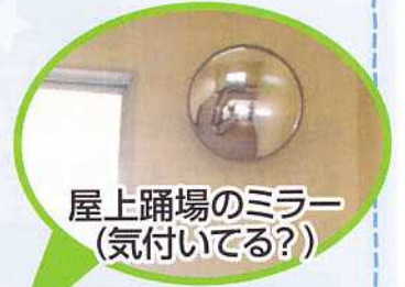
屋上踊場のミラー(気付いてる?)