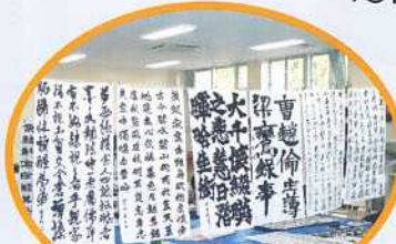
書道室(作品の並び)