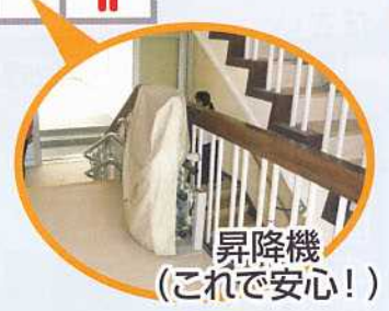
昇降機(これで安心!)

衛生面と安全面が考えられており、誰にでも使いやすいユニバーサルデザインとなっている。