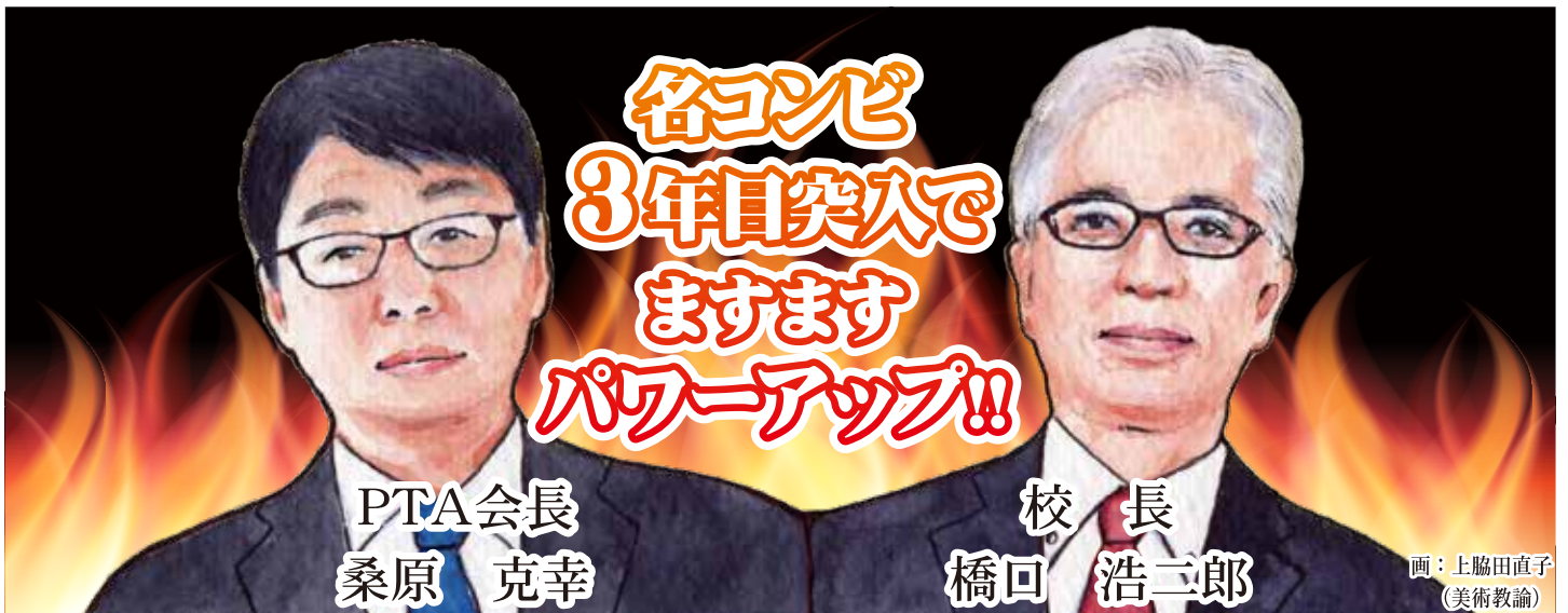
画：上脇田直子 (美術教諭)

高校は保護者の皆様にとって遠い存在になりがちですが、我々も交流を深め有意義に楽しく過ごしていきたいと思っております。様々な行事に積極的なご参加をお願いいたしますとともに、会員の皆様のご理解とご協力をお願い申し上げます。