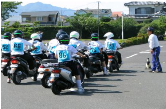
右見て左見て！ 単車実技講習会

六月十一日(月)に三年生を対象に、六月二十一日(木)には二年生を対象として単車実技講習会を寿自動車学校で実施しました。 普段、安全運転を心がけているとはいえ、より安全な運転マナーについて理解を深める機会となったようです。参加対象者は一五八名と多く、梅雨の中ということもあり真剣な態度で、全員講習に臨んでいました。全員が無事故・無違反の三星健児を目指しましょう。