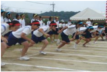
緊張の一瞬！ スタートダッシュ

20年度 三星祭テーマ 軌跡 ～The Past For Your Future～