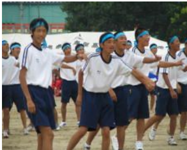
我が組の勝利を！ 必死の声援・応援