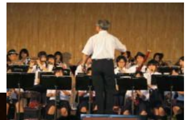
華麗な演奏 吹奏楽部

毎月発行するこの「三星の風」は、鹿屋高校のホームページにも掲載されています。 http://www.edu.pref.kagoshima.jp/sh/ka-noya/ 「鹿屋高等学校」でも検索できます。