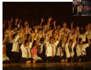
息の合った演技 ラインダンス