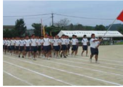
足並をそろえての 堂々たる入場行進