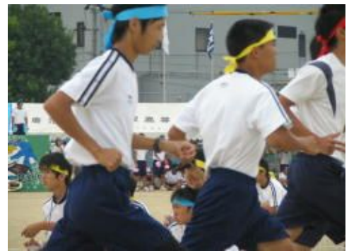
抜きつ抜かれつ！ 懸命の力走