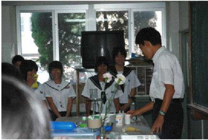
模擬授業講座（繊維を作ろう）

八月二十四日（火）に、中学三年生が高校の生活を体験する「鹿屋高校体験講座」を実施したところ、三五の中学校から約五〇〇人の参加がありました。 この行事は、中学三年生が本校の施設・設備を見学したり、模擬授業の体験をしたりすることで、高校の学習活動への理解を深める