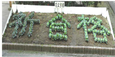
花文字園のメッセージ「初合格」

自然豊かな本校には多くの樹木や芸術作品があり、多くの野鳥も飛来します。また、一つの樹木や芝生も丁寧に手入れされており、昼食時間