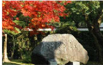
思索の森の校訓碑「知・徳・体」

自然豊かな本校には多くの樹木や芸術作品があり、多くの野鳥も飛来します。また、一つの樹木や芝生も丁寧に手入れされており、昼食時間