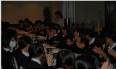
【サプライズ】全員でパースディソング