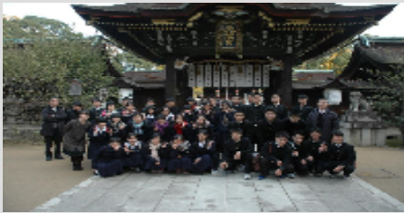
【北野天満宮】：心機一転！