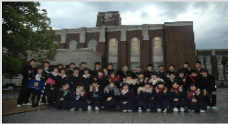
【京都大学】：最高学府を実感！

【四日目】海遊館を一時見学した後、新大阪駅へと移動し、帰鹿の途につきました。大きなトラブルもなく、予定どおりに行程を終えることができ、一年生にとって心に残る修学旅行となりました。