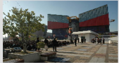
【解団式】：いささか心残り