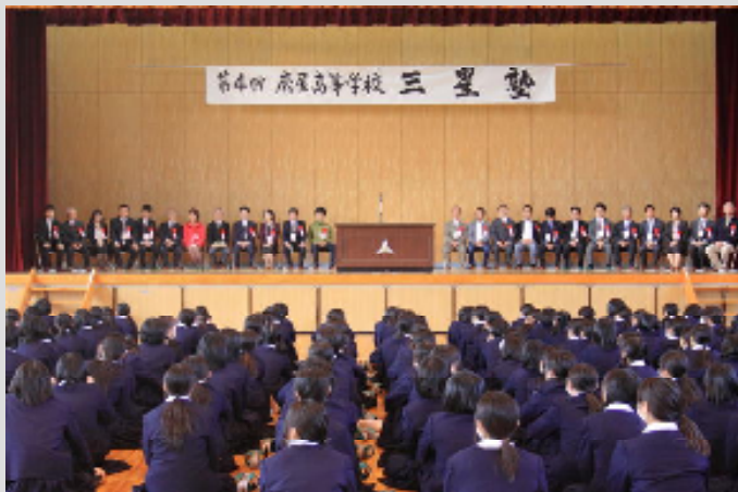
母校体育館の壇上に勢揃いした24名の凛々しき諸先輩方