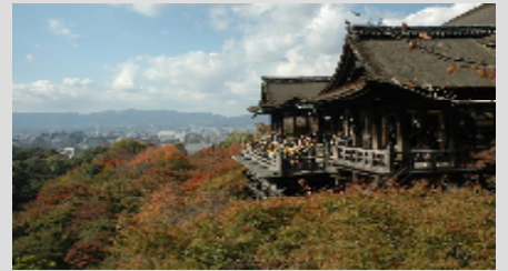
【清水寺】：ベストシーズン