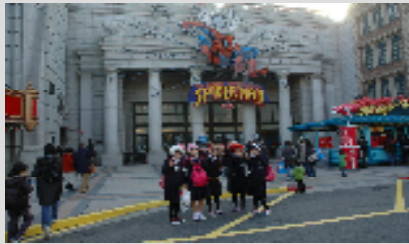
【USJ】：ファンタジーワールド