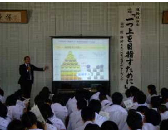
中だるみなどあり得ない！ 文武の主役二年生

並行して、同窓会館（三星会館）では二年生向けの進路講演会を実施しました。この企画は、合同LHRを利用して実施したもので、こちらもベネッセコーポレーションの劉耕助先生から、「二つ上を目指すために」と題して中だるみの学年といわれぬよう、どう学習と向き合うか、御指南いただきました。どちらの講演でも、鹿屋高校生に熱いエネルギーとメッセージをいただきました。