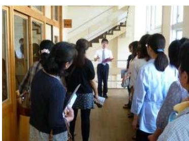
3年生の授業風景を見ていただきました。