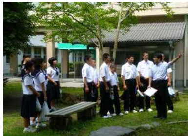
中庭にて。思索の森説明中。