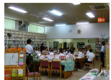
集中して聞いてくれています。