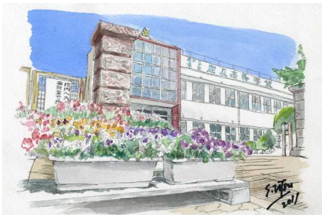
本校正門の風景画