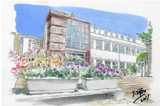
本校正門の風景画