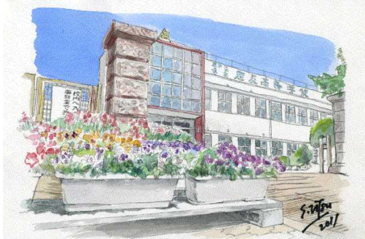
本校正門の風景画