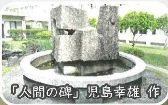
「人間の碑」 児島幸雄 作