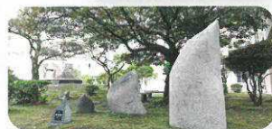
「風〜ふ〜ふ〜」 宮園広幸作