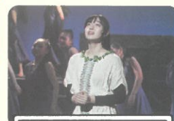
ミュージカル 赤狩山 心愛 先輩 (3年 鹿屋東中出身)