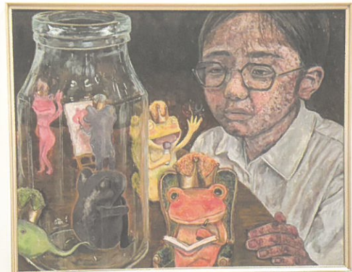
県高校美術展優秀賞