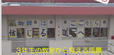
3年生の教室から見える風景