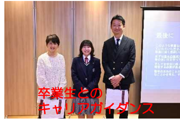
卒業生との キャリアガイダンス