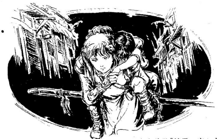
二木真希子「精霊の守り人」挿画 1996年、偕成社

シリーズ関連資料・文化人類学の研究資料・インタビュー映像・テレビドラマ・アニメ・マンガ関連の資料、異世界〈ナユク〉を表現したインスタレーションなどで物語の面白さを堪能！