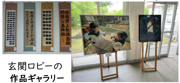
玄関ロビーの 作品ギャラリー

7月も残すところあとわずか。夏季補習もあと1日。8月の前半は、今までにまして自由になる時間が増えます。『夏を征するもの、受験を征す』と言ってきました。これからの頑張りや行動が大きな実りとなって帰ってきます。やらなかった人には、よい成果は起こりません。努力したことは、何より自分自身がよく分かっています。独りよがりにならず、冷静に判断しましょう