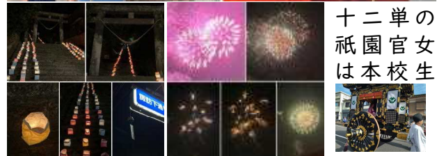
十二単の 祇園官女 は本校生