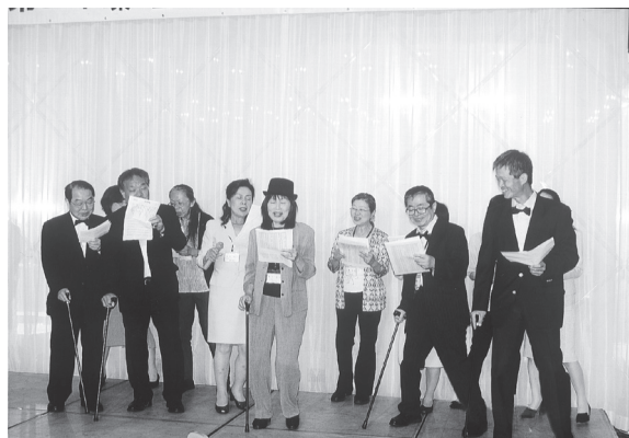
ピンキーとキラーズ

ロンドンオリンピックまで3ヵ月をきった6月上旬に開かれた東京同窓会、同期・同窓会・同郷と聞くと、心・気持ちが一つになるような気がする。と同時に母校・田舎の当時の様子が思い出されます。