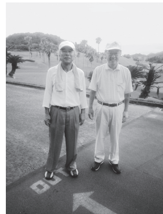
「螢火の如き一戸の灯も故郷」