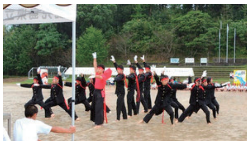
体育祭 応援団 演武