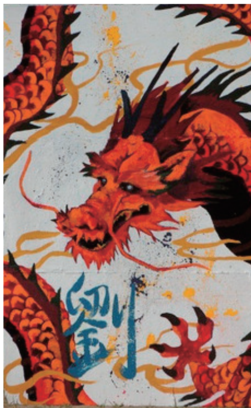
体育祭 応援パネル