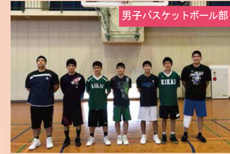
男子バスケットボール部