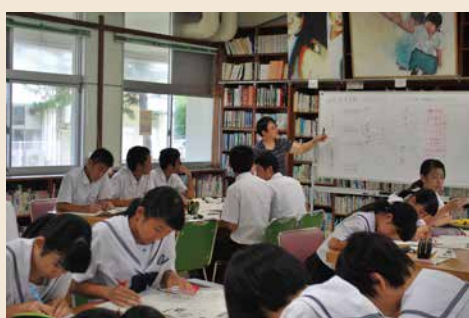
一日体験入学 (普通科)