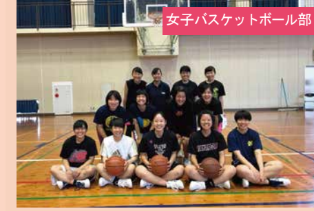
女子バスケットボール部