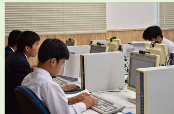
授業風景 (ビジネス情報)

私は、将来の夢はまだ決まっていませんが、高校生活の中でこれまで以上に多くのことを学び、人格を形成していく上で、自分に向いている職業を見つけたいと考えています。自分が就きたい職業を見つけたとき、少しでも就職で有利になるよう、商業科でしか取れない資格をたくさん取っておきたいです。商業科では、簿記・ビジネス基礎・情報処理という科目を学びます。パソコンや電車を使う機会も増えるので不安になるかもしれませんが、スタートは皆一緒なので一時間ごとの授業に集中し、検定合格にむけて精一杯頑張りたいです。また、普通科目では英語検定や漢字検定があります。私は英語が苦手なので英語検定に挑戦したいです。新しいことが多い高校生活ですが、何事にも積極的に取り組み、充実した三年間を送りたいです。