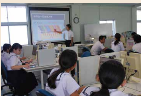
一日体験入学 (商業科)