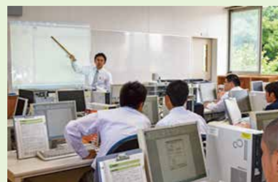
授業風景 (ビジネス基礎)