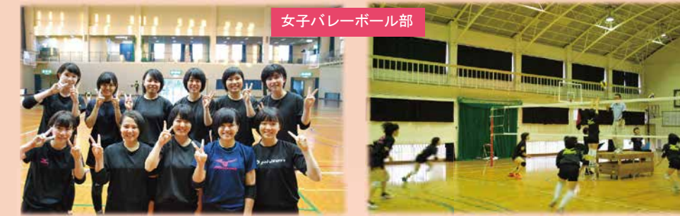
女子バレーボール部