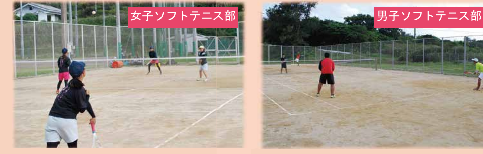
女子ソフトテニス部