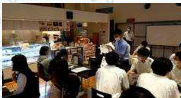
有限会社徳重製菓とらや霧や桜や