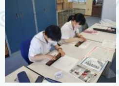
珠算九州大会への特訓