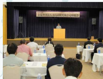
アクティブリポート霧島にて