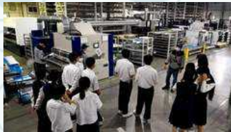
株式会社藤田ワークス