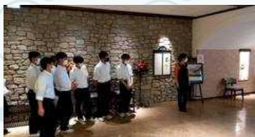
株式会社九州共立メンテナンス 霧島ラピスタヒルズ