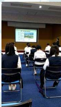
マイクロカット株式会社