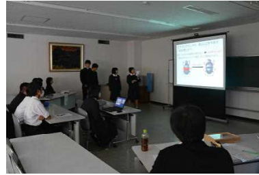
昆虫班の発表 「大隅諸島のエンマコガネの研究」