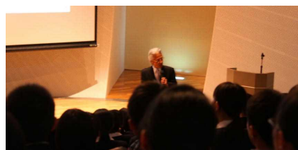
稲森会館で大学の概要・学部の紹介