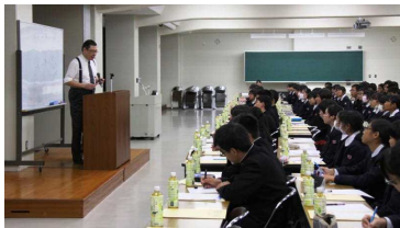
志学館大学にて特別講義

・・・11月15日(水)「総合的な学習の時間」における大学訪問として、1年生が、鹿児島大学と志学館大学を訪問しました。実際に施設見学や大学・学部の概要説明をしていただき、生徒たちにとって、将来の目標設定や文系・理解の選択についての大きな参考になり、進路意識の高揚につながったと思います。