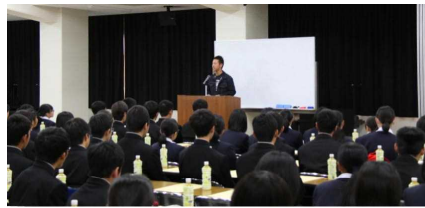
卒業生からの激励(在学中は野球部)