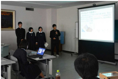
地学班の発表 「天降川の旧河道の研究」

11月10日(金)、鹿児島市の宝山ホールで、県高等学校生徒理科研究発表大会が開催されました。なんとポスター部門を含めて全国大会5部門中3部門で出場権を獲得!これは昨年に並ぶ成績で、2年連続の快挙となりました。さらに九州大会の出場数は昨年を超えて4チーム!国分高校理数科史上最高の成績となりました。鹿児島県の理科研究発表大会の歴史を見ても最高の成績です。発表した2年生の皆さん、お疲れ様でした。