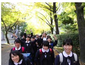
美しく色づいた鹿児島大学の銀杏並木