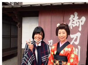
江戸時代にタイムスリップ