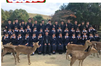
鹿と一緒に記念撮影(奈良公園) 薬師寺でありがたい法話