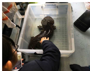
巨大なオオサンショウウオ