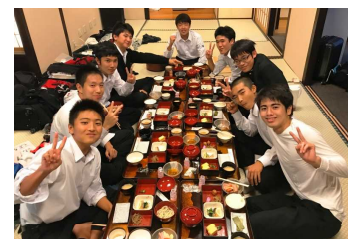
ホテルで豪華な夕食