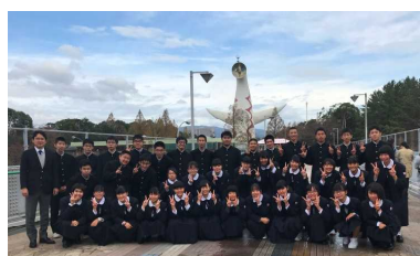
太陽の塔前の公園にて