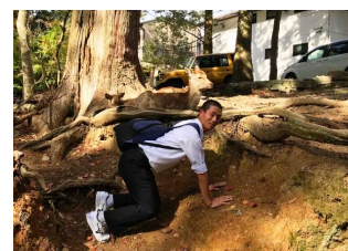
鹿の気持ちになってます

今回、経験したことをこれからの学校生活とそれぞれの進路に生かし、社会に貢献する人物へと大きく成長して欲しいと思います。