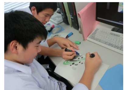
パンフレット作成中です

霧島ジオパークの英文を読み, カルデラなどの説明は, 地学の先生に補足していただきながら, それぞれテーマをもったパンフレットを作成できました。英語で表現することの難しさも感じていましたが, 今後の課題研究の取り組みの練習になったようでした。