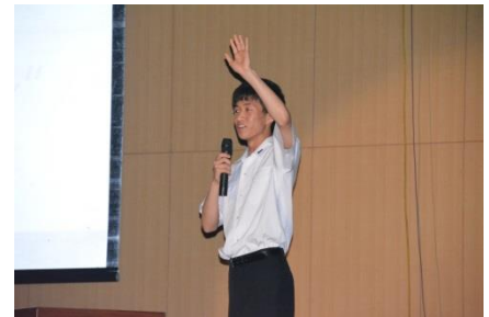
上: 理数科地学班の発表