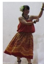
ALOHA HULA AMAMI