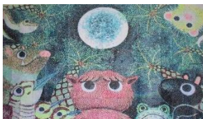
3年地歴公民選択者 モザイクアート