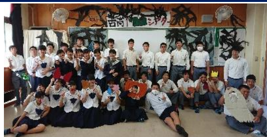
1年1・2組 「古高1年 TUBE」

10月28日(土)本校体育館をメイン会場とし、第63回文化祭が行われました。舞台・展示の2部門に分かれ、各学級、各部活動等が発表しました。文化祭まで生徒は互いに意見を出し合いながら協力して作品を作り上げていました。また、PTA文化部の皆様を中心に、PTA食物バザーを実施していただきました。台風接近による悪天候の中ではありますが、多数の保護者や地域の方々にご来場いただき、活気あふれる文化祭となりました。御来場くださった皆様、誠にありがとうございました。