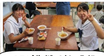
PTA食物バザーのカレーライス とっても美味しかったです!!