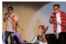
吹奏楽部スペシャルゲスト