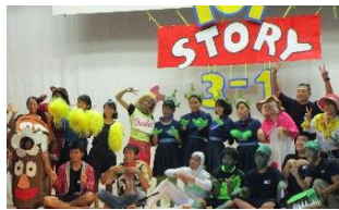
3年1組 「トイ・ストーリー3」