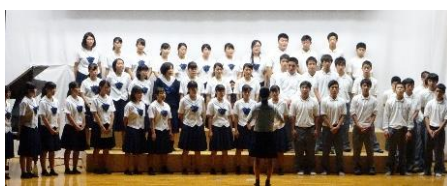
音楽選択者「ぼくは ぼく」