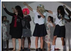
2年1組 「不思議の島のアリス」