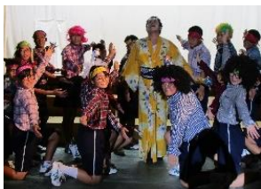
2年2組 「パカっいいい」