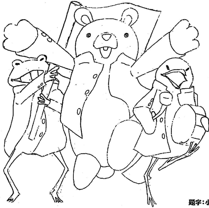
題字:小田 風夏 イラスト:神 優太