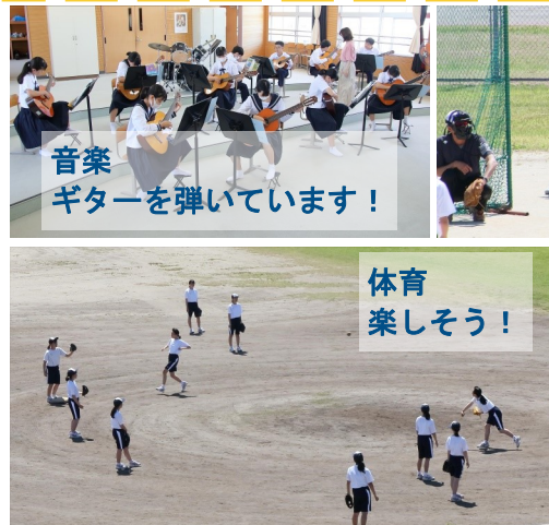
音楽 ギターを弾いています！

六月八日(月)から六月十九日(金)までの二週間、相互授業参観を行いました。教員が様々な授業を見学に行き、自分の授業に活かしていくためのものですが、生徒の意外な一面や他の授業での様子等を知ることができたのも嬉しいポイントでした。突