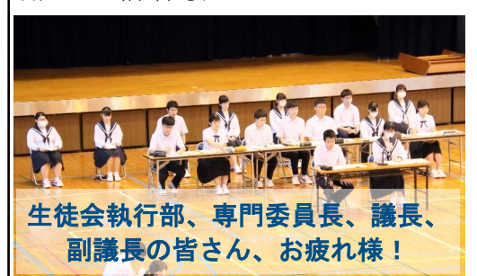
生徒会執行部、専門委員長、議長、副議長の皆さん、お疲れ様！

他にも昨年度の生徒会事務報告や生徒会会計決算報告、監査報告、今年度の生徒会予算の承認等を行いました。各専門委員会や生徒会執行部がどのような活動をしているか、予算がどのように割り振られ、使用