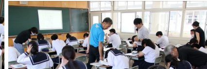
串木野高校のホームページ！