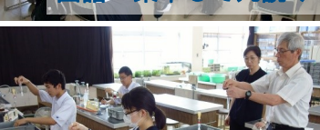
化学 コロイドの性質とは

http://www.edu.pref.kagoshima.jp/sh/Kushikino/top.html 普通の生徒の様子から行事を楽しむ姿まで……さらには珍しい虹も！？ 広報係一同、愛情をもって取材・更新しています！楽しい串高ライフをご覧ください。「鹿児島県立串木野高等学校」で検索！