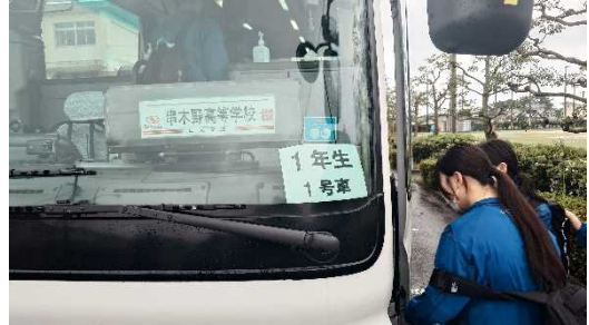
今年はバス4台での移動でした。