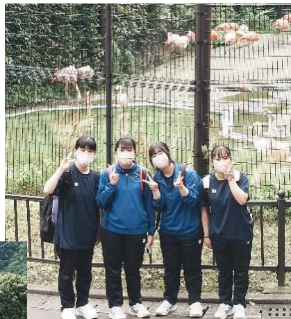
フラミンゴの前でピース バクは夢を食べる？ 撮影中の様子を撮影