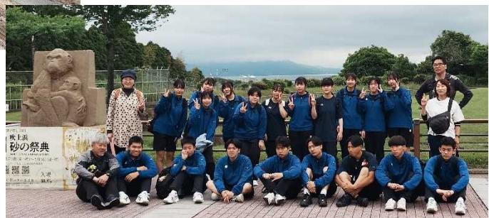
まずは、クラスごとの集合写真を撮ってから