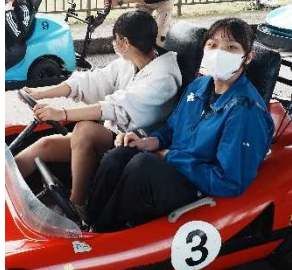
午後は、ゴーカート 観覧車・チェーンタワー