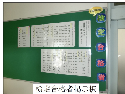
検定合格者掲示板