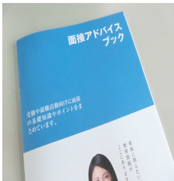
(株)JSコーポレーション提供 『面接アドバイスブック』

7月12日火曜日に3年生の就職希望者を対象にした面接講話が実施され、34名の生徒が参加しました。面接講話では、面接のための冊子『面接アドバイスブック』を元に面接基礎で必要とされる身だしなみや言葉遣いをはじめ、お辞儀の仕方と角度の練習、志望動機の適切な長さなどを詳しく説明されました。参加した生徒は熱心にメモを取りながら、講話を聞いていました。