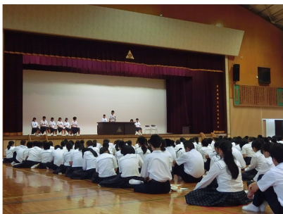
立会演説会の様子