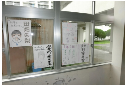
立候補者のポスター

7月7日木曜日に生徒会役員選挙が行われ、生徒会長・副会長が選出されました。改選当日に行われた立会演説会で立候補者は、学校行事の充実や行事を通して地域と関わりのある学校づくり、ボランティア活動の活性化、伝統を重んじる学校など枕崎高校をより良い学校にすることを訴えていました。投票の結果は、次の通りです。