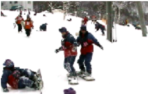
どいてどいて、スノボは急に止まれない

一月二十五日から二十八日の三泊四日の日程で、二年生待望の修学旅行が行われました。まず長野県でスキーやスノーボードを体験しました。ほとんどの生徒が初心者でよく転び雪まみれになりながらも、一日を終える頃にはかなり上達し、雪のかなり上達し、雪の帰路につきましました。