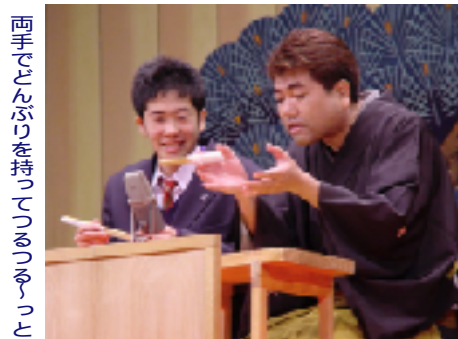
両手で扇子を持ってつまみつき