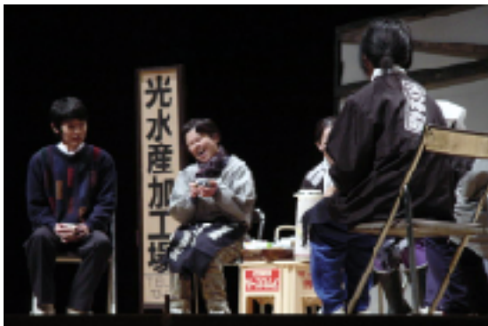
地元の水産会社で進学費用を稼ぐ主人公(左)

二月九日、総合学科学習活動発表会が行われ、各学年の代表がそれぞれ舞台にあがり、スクリン等を使って発表しました。これからは枕崎の特産でのテーマについてある「かつお」について、あなたはどれだけの研究の面白さについて知っていますか？興味を持ったようにタイトルで知っていました。