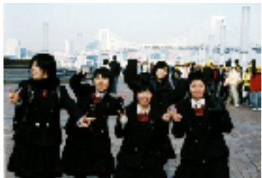
レインボーブリッジの前で

他のクラスメイトとも仲良くなり充実した旅行だった。でもやはり家に帰り着くとほっとした。