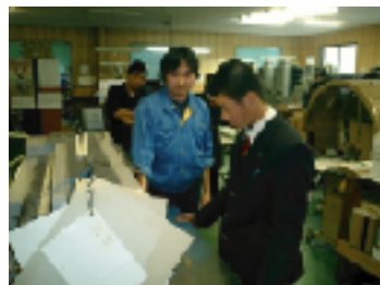
南薩新生社(如世田市)で実習をする生徒

二月十五日、二年生就職希望者十九名が事業所訪問に参加しました。川辺地区の六事業所を訪問し、各事業所の担当者から仕事内容の説明や施設見学をさせていただきました。枕崎市かつお公社と枕崎漁業協同組合では、零下四〇度の冷凍庫製氷