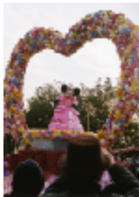
ディズニーランドの華やかなパレード

一月二十五日から二十八日の三泊四日の日程で、二年生待望の修学旅行が行われました。まず長野県でスキーやスノーボードを体験しました。ほとんどの生徒が初心者でよく転び雪まみれになりながらも、一日を終える頃にはかなり上達し、雪のかなり上達し、雪の帰路につきましました。