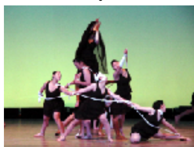
ダンス部は創作ダンス「みえない出口」を披露

二月十五日、二年生就職希望者十九名が事業所訪問に参加しました。川辺地区の六事業所を訪問し、各事業所の担当者から仕事内容の説明や施設見学をさせていただきました。枕崎市かつお公社と枕崎漁業協同組合では、零下四〇度の冷凍庫製氷