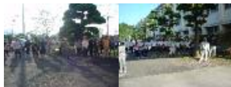
部活動単位での参加もありました。