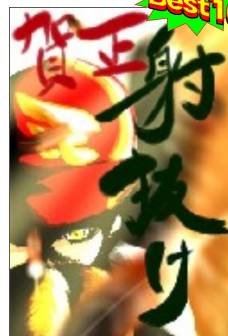
<ルーキー応援部門>