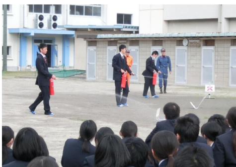
代表生徒3名が消火器訓練を実施