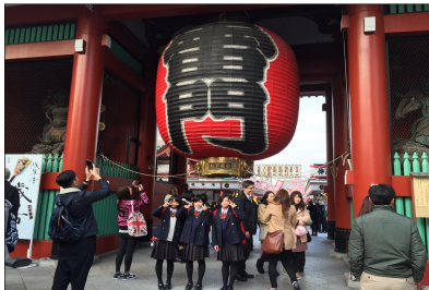
浅草寺・雷門(上) 東京ディズニーランド(左) 宿泊先ホテルでの食事(右上) 東京スカイツリー(右下)