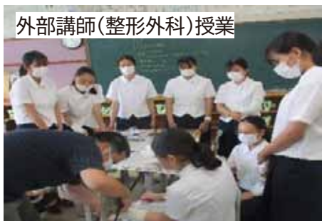
外部講師(整形外科)授業