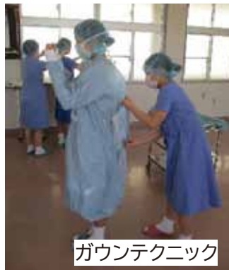
ガウンテクニック