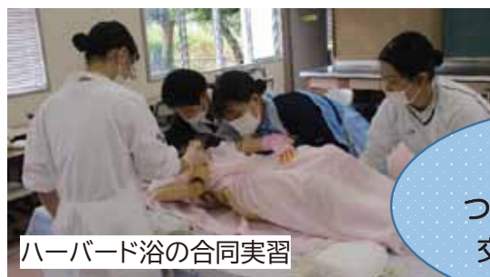
ハーバード浴の合同実習