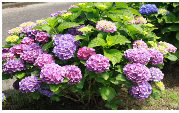
中庭の紫陽花も満開です。