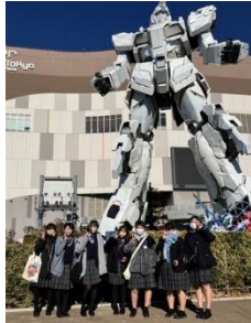
ガンダムと一緒に！