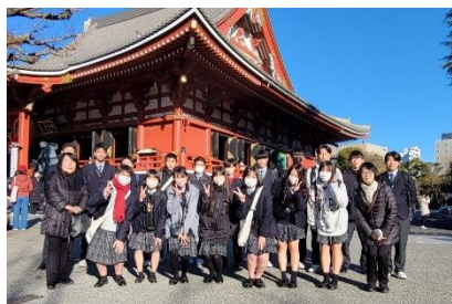
浅草寺境内での1コマ