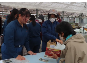
接客, 包装も上手でした。