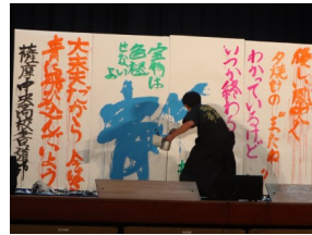
オープニングアクト(書道)

11月11日(土), 『全力で楽しもう！青春Festival』のテーマのもと, 第19回かぐや祭が開催されました。クラスや部活動, 同好会や教科別の作品など, 様々な発表や展示が披露されました。どれも若い感性や情熱にあふれ, 日々の学習の成果が存分に発揮された個性溢れるものばかりでした。薩摩中央高校生の可能性を垣間見た素晴らしい文化祭でした。