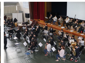
有志によるオーケストラ