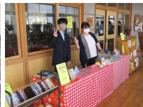
古本屋も盛況でした。