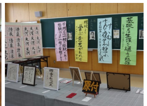
書道選択者の作品展示