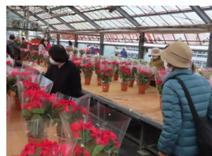
鮮やかなポインセチアが並びます。