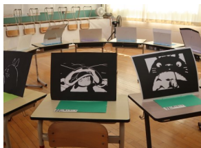
素敵な展示もたくさん!!