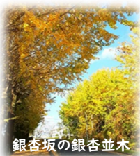
銀杏坂の銀杏並木