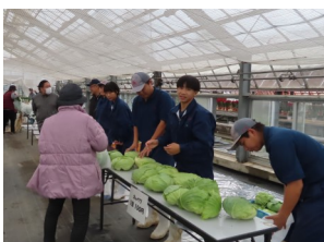
新鮮な野菜が大人気でした。

12月8日(金)に農業科の生徒達による収穫感謝祭が行われました。自分たちで頑張って育てた農産物の豊穡に感謝しながらみんなで頂きました。生産だけでなく, 消費までを通して, 農業と食の大切さと素晴らしさを再認識する良い機会となりました。