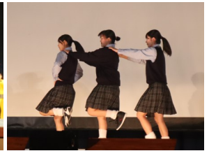
息ピッタリのダンス