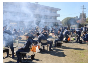
良い天気でBBQ日和でした。