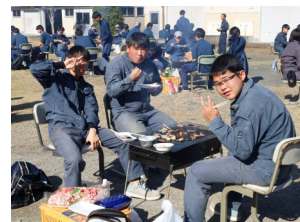
美味しくいただきます。