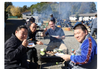
先生方もALTも一緒に。