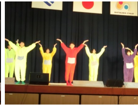
ステージも大盛り上がり!!