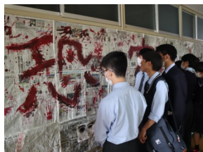
怖いけど入りたい。けど怖い...