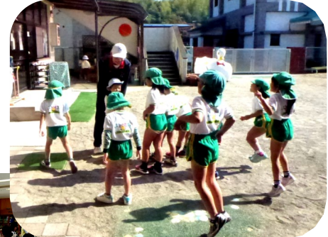
総合選択保育実習

11/5(月)吉祥園保育所の様子 ※普通科・農業工学科・生物生産科の保育選択者12人(男子5人・女子7人)が聖母幼稚園・吉祥園保育所で実習