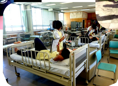
2年福祉科 介護実習

11/5(月)吉祥園保育所の様子 ※普通科・農業工学科・生物生産科の保育選択者12人(男子5人・女子7人)が聖母幼稚園・吉祥園保育所で実習