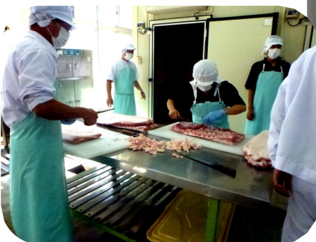
3年農業工学科農芸化学コース ベーコンの仕込み (100キロ準備しました！)