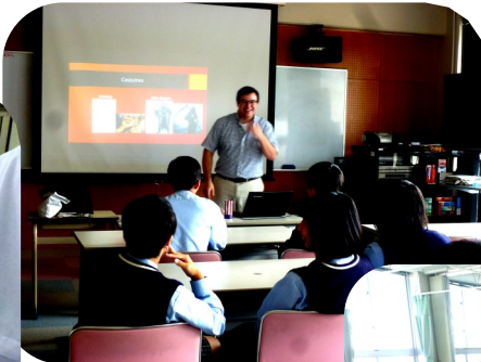
3年生物生産科 ALT・スポンサーとの授業 (ハロウィンについて)