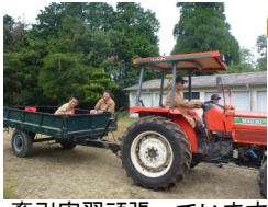
牽引実習頑張っています！