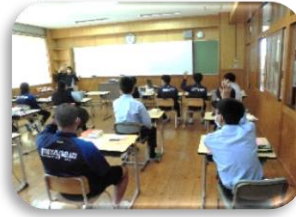
コミュニケーション英語

宮之城中学校の3年生が就職・進路学習の一環として、薩摩中央高校の授業を体験しました。本校ならではの特色ある様々な専門的な授業に、高校生と一緒に積極的に参加してくれました。