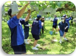
課題研究・果樹の管理