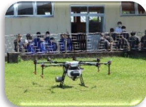
課題研究・ドローン飛行演習