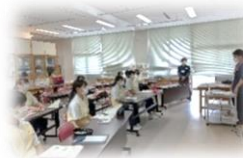
外部講師による講話

3年生福祉科が5月16日(月)から6月6日(月)まで三年間の総仕上げとなる介護実習を行いました。新型コロナウイルス感染症予防で校内での実習となりましたが、計画に基づいて将来、社会福祉に携わる者として資質の向上につとめました。介護施設の実習指導者や外部講師の先生方からの指導も受けるなど、生徒たちは実りある実習を終えることができたようです。