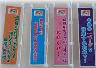
事務室前に置いてあるミニチュア

令和4年度「薩摩中央高校のぼり旗」が完成しました!のぼり旗を飾るメッセージは昨年度の3月に生徒たちに募集したものです。色鮮やかで素敵なメッセージが入ったのぼり旗は、薩摩中央高校の魅力をアピールしてくれています。銀杏坂やメルヘン坂を彩るのぼり旗をぜひご覧ください。