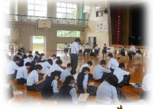
総会での意見交換