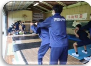
体育・ウエイトリフティング