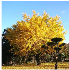
武道館横の大イチョウ