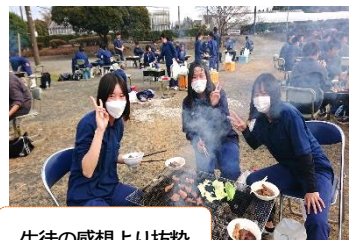
生徒の感想より抜粋