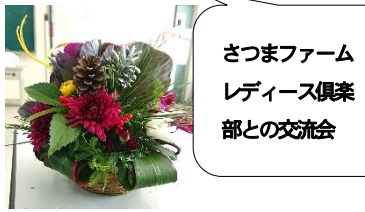
さつまファームレディーズ倶楽部との交流会