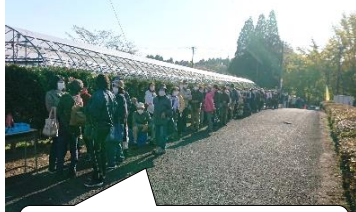
毎年、開店前から大行列