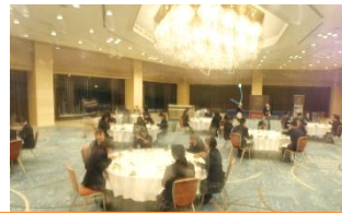
緊張気味のディナー@城山ホテル鹿児島