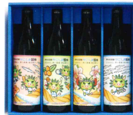
幻の国体焼酎ラベルデザイン