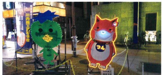
駅前イルミネーション