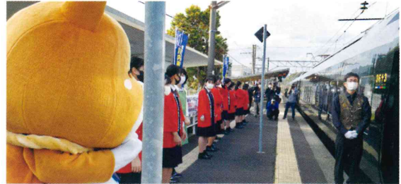
観光列車「36ぶらす」おもてなし