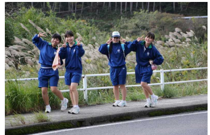
「友と語らいながら！まだまだ余裕・・・？」