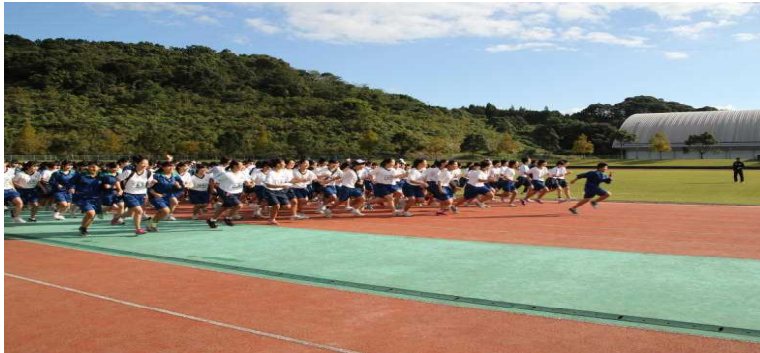
「元気いっぱいスタート！」(男子9:00 女子9:10)

11月11日(金)に第39回強歩大会が、総合運動公園陸上競技場をスタート/ゴールとし、陽成小、旧吉川小、平成中付近を経由する30Kmのコースで行われました。当日は天候に恵まれ、生徒たちは日頃の体育活動の成果を十分発揮することができました。当日は多数の保護者の皆様にご支援やご声援を頂き大成功に終わりました。