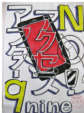
生徒会が作成したポスター