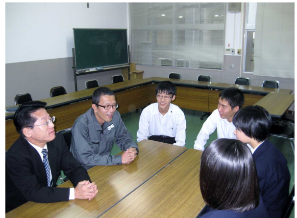
携帯・スマホの利用について、PTAと生徒会との話し合い