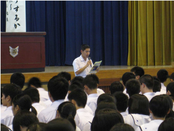
生徒会長が2学年PTAで生徒・保護者に訴えました。

「夜9時以降は携帯・スマホの利用による友達との連絡を控えよう！」という取組を生徒会とPTAが協働して行っています。毎月9のつく日は（9日・19日・29日）は「ノーアクセスアフター9の日」としました。