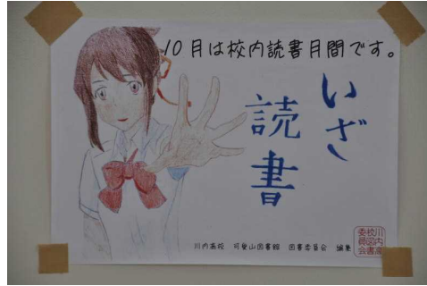
↑ 図書委員作成のポスター