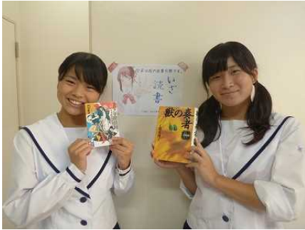
読書を通して心豊かに！

本校では10月を読書月間として位置づけ、図書委員を中心に読書を推進しています。校内には31種類・197枚のポスターが張られました。図書館での貸し出し冊数は昨年よりも大幅に増加し、2414冊でした。