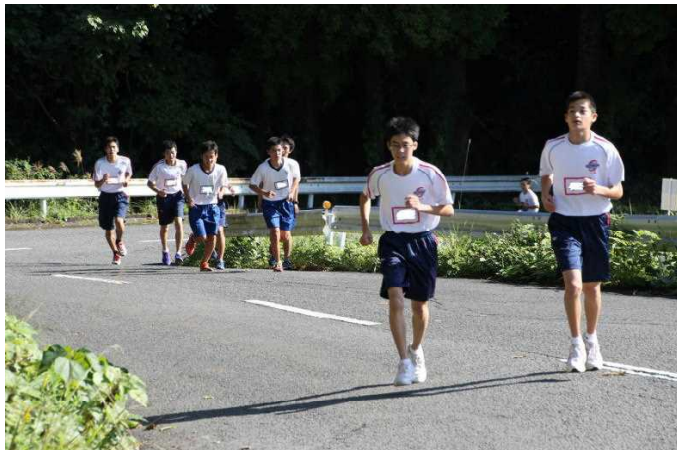
「苦しい坂も黙々と頑張る川高生！」