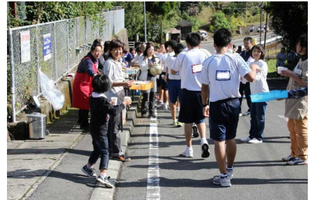
「保護者の皆さんからの熱い声援！」