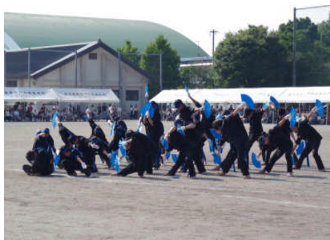
美しい円熟の演武3年生