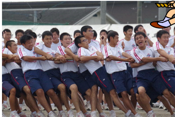
学年の名誉をかけて