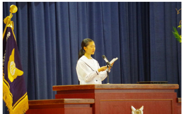
生徒代表喜びの言葉

「学年ビリのギャルが1年で偏差値を40上げて慶應大学に現役合格した話」の著者で坪田塾塾長の坪田信貴氏が「子どもと自分の底力を圧倒的に引き出すら