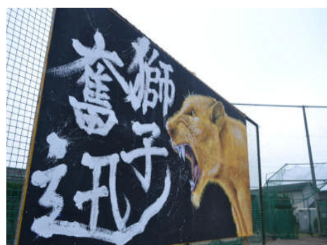
迫力の応援パネル