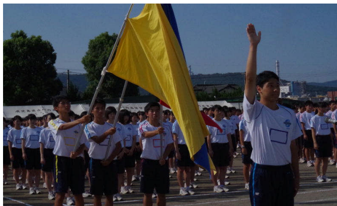
勝利を期して選手宣誓

閉会式校歌斉唱では、全生徒が校長と教頭を交えて校歌を熱唱し、体育祭を締めくくりました。