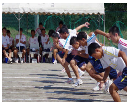
学級の威信をかけて全力疾走