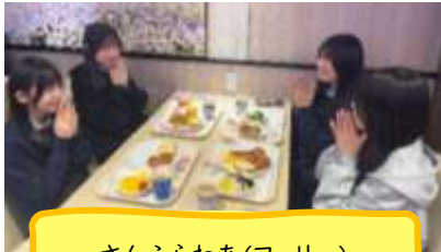
さんふらわあ(フェリー)