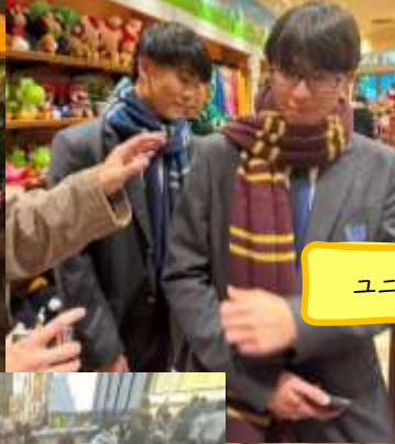
ユニバーサル・スタジオ・ジャパン