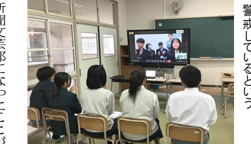
秋田では熊の出没に日々警戒しているという

交流会を行った。新聞部の顧問向けの全国研修会で発表されていた能代松陽高校の顧問の先生に、本校顧問が交流をもちかけたことで実現した。