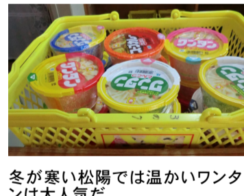
冬が寒い松陽では温かいワンタンは大人気だ

朝読書でついた 読書の習慣 そして、SHR後の「朝読書の時間」。図書館で借りた小説を開き、その世界に没入する。気が付けば校歌が鳴り、名残惜しさを感じつつ現実