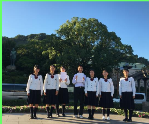
▲昨年度県大会出場の部員

本校科学部生物班は、昨年度の県大会で「カマキリの体内に潜む寄生虫についてV」という研究で全国大会への代表権を獲得し、全国高等学校総合文化祭 2020 こうち総文に出場しました。WEB上での大会開催となりましたが、発表練習を繰り返し、素晴らしい研究作品に仕上がりました。発表映像は10月31日までWEB総文ホームページ ( https:// www.websoubun.com/ ) に掲載されています。