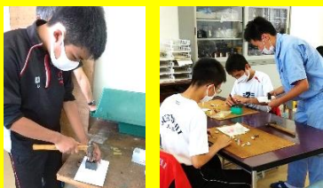
▲ストラップ制作（他にも溶接や旋盤の体験学習がありました。）